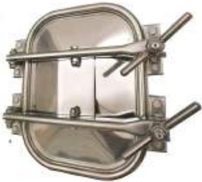
PUERTA RECTANGULAR PARA CEMENTO 318X420MM. APERTURA EXTERNA ART. 122