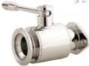
VALVULA DE BOLA INOX. BRIDA OVALADA-RACOR ENOLOGICO FIG. 121