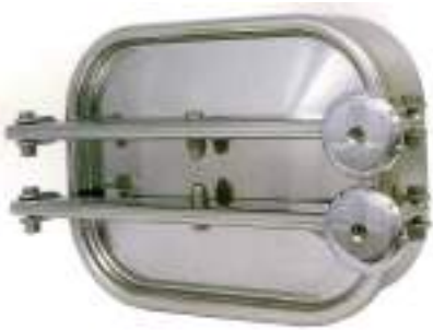
PUERTA RECTANGULAR 420X318MM. APERTURA EXTERNA ART. 121