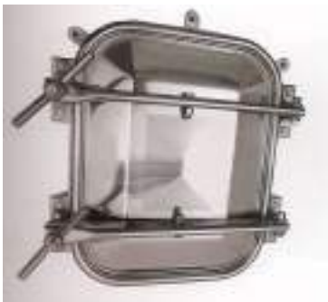
PUERTA RECTANGULAR PARA CEMENTO 420X530MM. APERTURA EXTERNA ART. 112