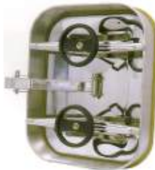
PUERTA RECTANGULAR 420X530MM APERTURA INTERIOR CON ARTICULACION ART. 118