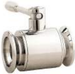
VALVULA DE BOLA INOX. RACOR ENOLOGICO-ENOLOGICO FIG. 119