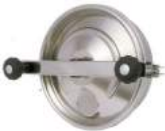
PUERTA CIRCULAR O 330MM APERTURA EXTERNA CON DOS POMOS ART. 313