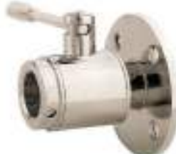
VALVULA DE BOLA INOX. BRIDA PN6-ROSCA GAS HEMBRA FIG. 123