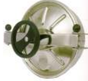
PUERTA CIRCULAR O 400MM. APERTURA EXTERNA CON VOLANTE CENTRAL ART. 314