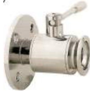
VALVULA DE BOLA INOX. BRIDA PN6-RACOR ENOLOGICO FIG. 124