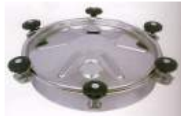
BOCA CIRCULAR O 500MM CON SEIS CIERRES ART. 425