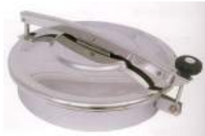
BOCA TIPO ASEPTICO O 400MM LEVANTAMIENTO VERTICAL Y LATERAL ART. 444