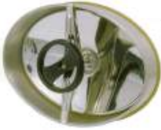
PUERTA OVALE 450X320MM APERTURA INTERIOR ART. 210