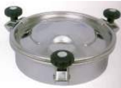
BOCA CIRCULAR O 300MM CON TRES CIERRES ART. 423