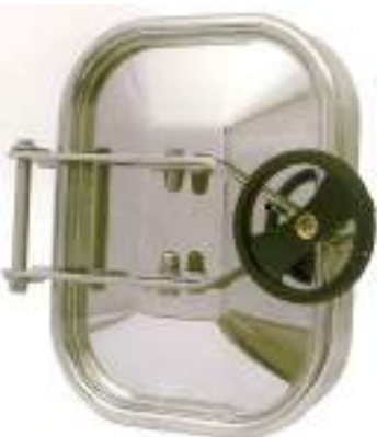
PUERTA RECTANGULAR 318X420MM. APERTURA EXTERNA ART. 124