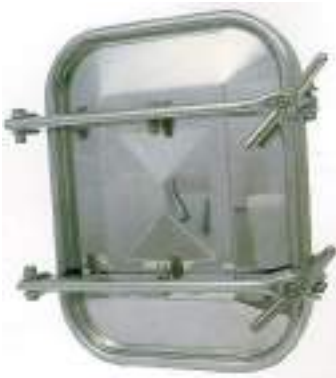
PUERTA RECTANGULAR 420X530MM. APERTURA EXTERNA ART. 110