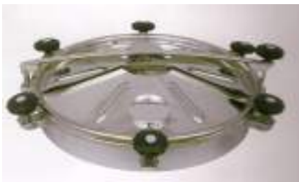
BOCA CIRCULAR O 600MM. LEVANTAM. VERTICL Y LATERAL + 6 CIERRES ART. 436