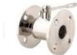
VALVULA DE BOLA INOX. BRIDA-BRIDA PN6 FIG. 122