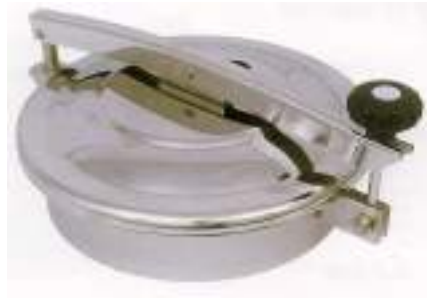
BOCA TIPO ASEPTICO O 300MM LEVANTAMIENTO VERTICAL Y LATERAL ART. 443