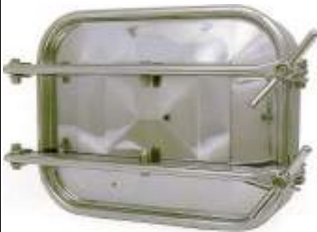
PUERTA RECTANGULAR 530X420MM. APERTURA EXTERNA ART. 111