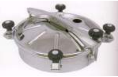
BOCA CIRCULAR O 400MM. LEVANTAM. VERTICL Y LATERAL + 4 CIERRES ART. 434