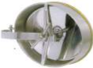
PUERTA OVALE 450X320MM APERTURA INTERIOR CON ARTICULACION ART. 211