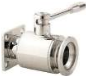
VALVULA DE BOLA INOX. BRIDA CURVADA-RACOR ENOLOGICO FIG. 120