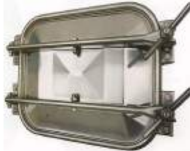
PUERTA RECTANGULAR PARA CEMENTO 530X420MM. APERTURA EXTERNA ART. 113