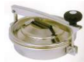
BOCA CIRCULAR O 220MM. LEVANTAMIENTO VERTICAL Y LATERAL ART. 412