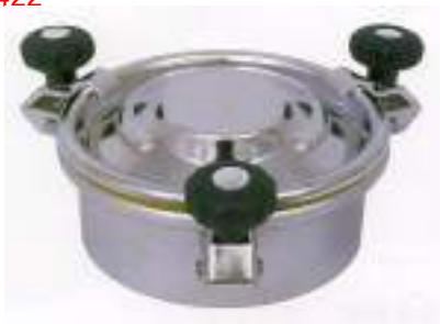
BOCA CIRCULAR O 220MM. CON TRES CIERRES ART. 422