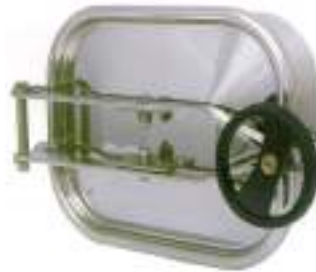
PUERTA RECTANGULAR 420X318MM. APERTURA EXTERNA ART. 125