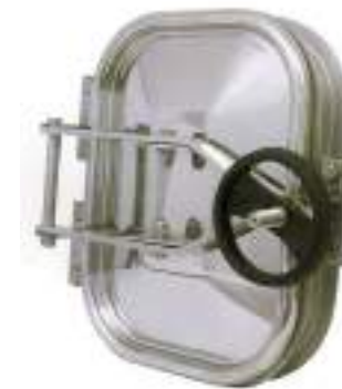
PUERTA RECTANGULAR PARA CEMENTO 318X420MM. APERTURA EXTERNA ART. 126