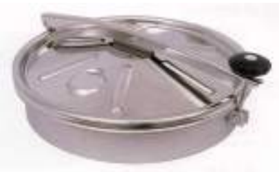
BOCA CIRCULAR O 500MM. LEVANTAMIENTO VERTICAL Y LATERAL ART. 415