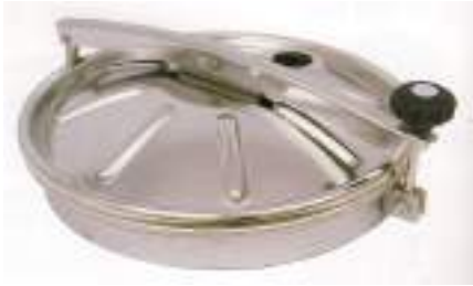
BOCA CIRCULAR O 400MM. LEVANTAMIENTO VERTICAL Y LATERAL ART. 414