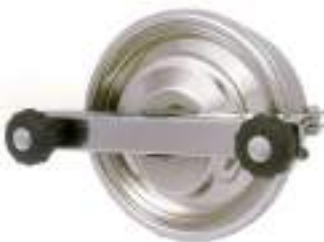
PUERTA CIRCULAR O 220MM. APERTURA EXTERNA CON DOS POMOS ART. 312