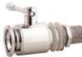
VALVULA DE BOLA INOX. ROSCA GAS CON TUERCA PARA TINO MADERA-RACOR ENOLOGICO FIG. 125