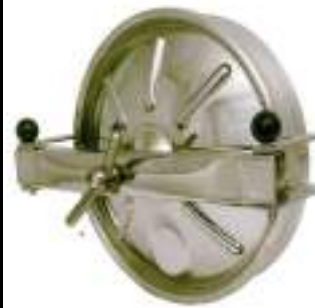
PUERTA CIRCULAR O 400MM. APERTURA EXTERNA PARA VINIFICACION ART. 324