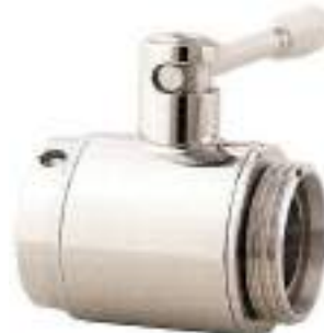
VALVULA DE BOLA INOX. ROSCA GAS HEMBRA-MACHO NW FIG. 126