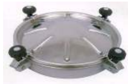
BOCA CIRCULAR O 400MM CON CUATRO CIERRES ART. 424