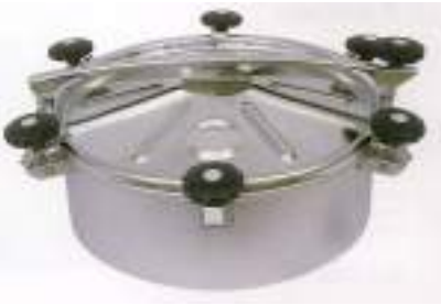
BOCA CIRCULAR O 500MM. LEVANTAM. VERTICL Y LATERAL + 6 CIERRES ART. 435