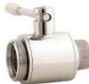
VALVULA DE BOLA INOX. ROSCA MACHO-MACHO NW FIG. 127