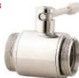
VALVULA DE BOLA INOX. BRIDA-BRIDA PN6 FIG. 128